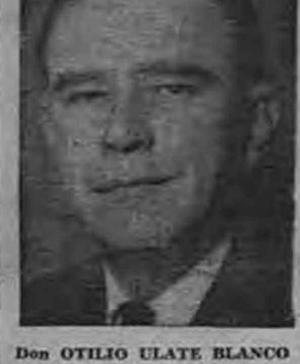
Don OTILIO ULATE BLANCO

Los impuestos sobre el capital tienen, en la historia económica, un carácter de recursos de emergencia para el Estado. En este concepto, el impuesto del 10% sobre el patrimonio ha cumplido su tarea contribuyendo al pago de la deuda pública originada de la recuperación de los destrozos fatalmente ocasionados por la guerra civil, que todos los costarricenses juzgamos necesaria y justa. Al pago de esa deuda sigue afectado el producto de ese impuesto, en su totalidad, hasta la última cuota, de modo que ni el Gobierno actual ni los que le sucedan podrán contar con ningún aporte fiscal derivado de la recaudación de ese tributo. Ni creo que dispute nadie la legitimidad