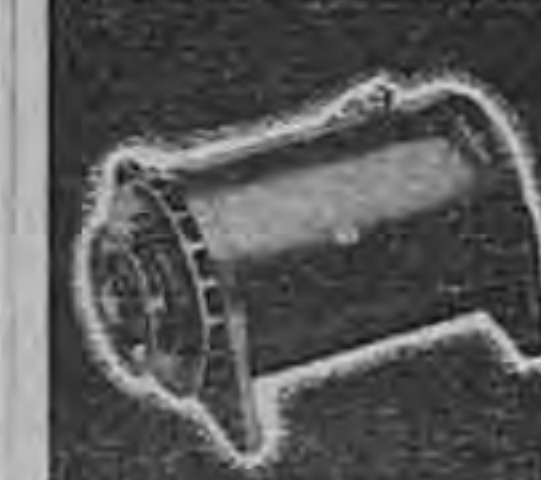
SISTEMAS ELECTRICOS Auto-Lite