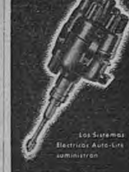
Los Sistemas Electricos Auto-Lite suministran

INSISTA EN AUTO-LITE PARA Mayor Eficiencia del Servicio