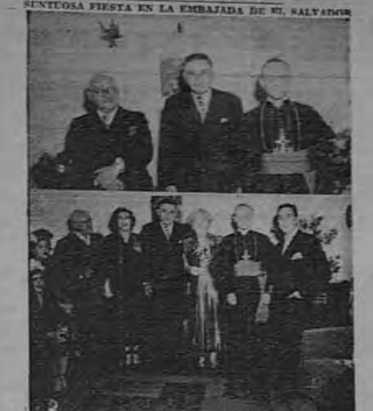
Suntuosa fiesta en la Embajada de M. Salvator...